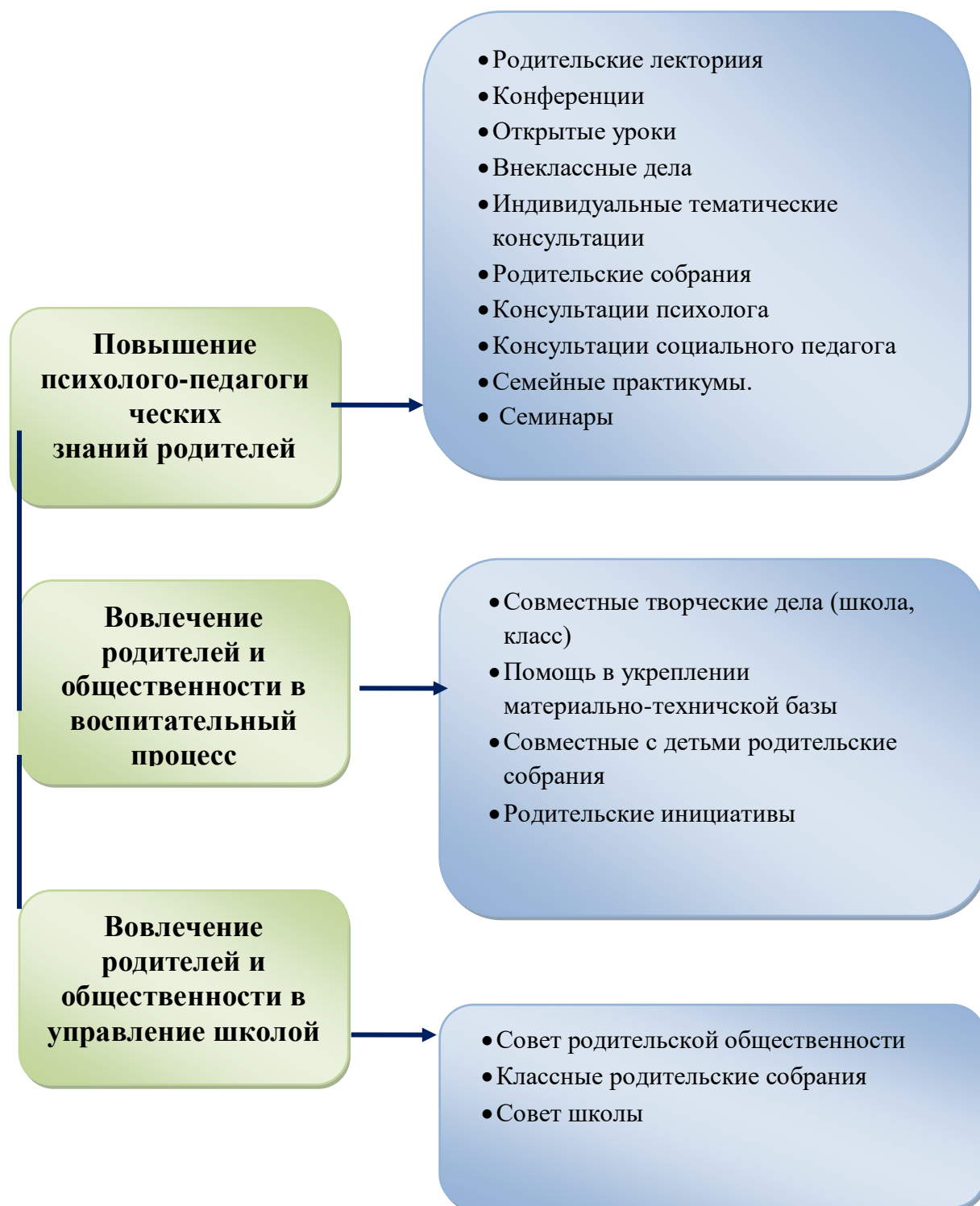
Схема взаимодействия семьи и школы

Планируемый результат: уровень сформированности социальной компетентности обучающихся.