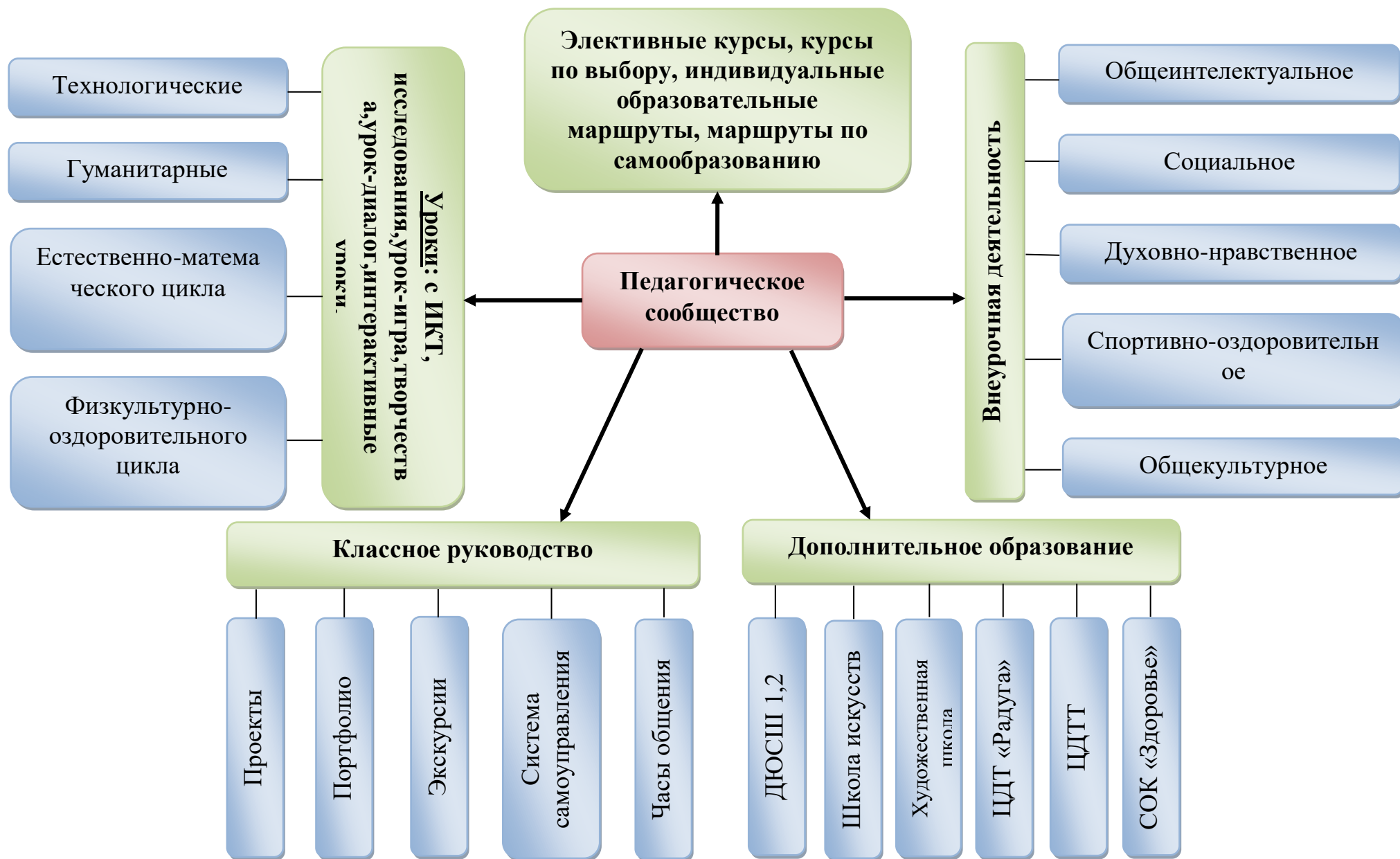
Модель связи урочной и внеурочной деятельности